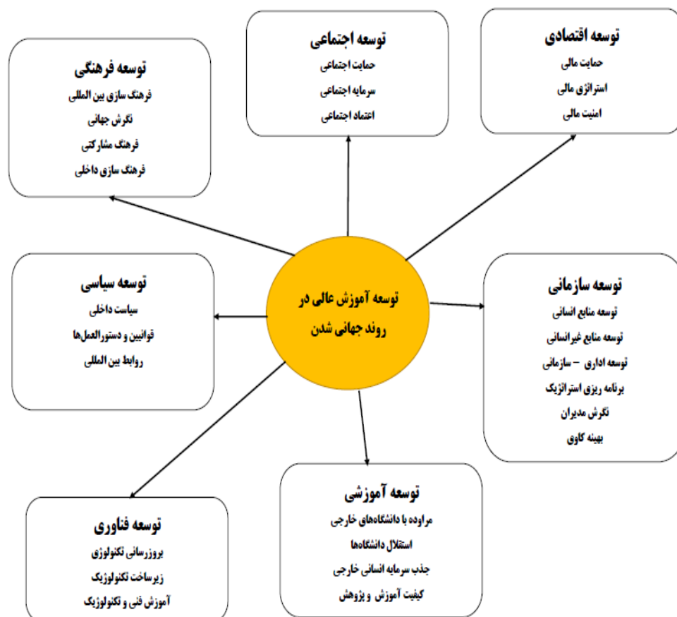
شکل ۱. مدل توسعه آموزش عالی در روند جهانی شدن

هدف تحقیق حاضر تعیین وضعیت موجود ابعاد و مؤلفه‌های تبیین‌کننده توسعه آموزش عالی در روند جهانی شدن بود. برای بررسی سوال فرعی سوم پژوهش با توجه به حجم نمونه (قضیه حد مرکزی) از آزمون t تک نمونه‌ای استفاده می‌کنیم. از آنجائیکه گویه‌ها با پاسخ لیکرت پنج گزینه‌ای می‌باشند، میانگین کسب شده برای هر متغیر را با مقدار ثابت ۳ (میانگین، میانه) مقایسه می‌کنیم، فرضیه صفر در این آزمون برابری میانگین با مقدار ۳ است و زمانی که مقدار t محاسباتی بزرگ و یا مقدار Sig. کوچکتر از 0.05 باشد، فرضیه برابری رد شده و اگر میانگین متغیر کمتر از ۳ باشد، یعنی اینکه وضعیت متغیر مورد نظر کمتر از مقدار متوسط (نامطلوب) است و اگر میزان میانگین متغیر تحت بررسی بیشتر از ۳ بوده باشد، یعنی اینکه وضعیت آن متغیر بیشتر از حد متوسط (مطلوب) است و اگر مقدار Sig. بیشتر از 0.05 باشد، یعنی اینکه وضعیت متغیر مورد نظر در حد متوسط است. قابل ذکر است در جداول زیر منظور از فرضیه صفر میانگین مساوی با مقدار ثابت ۳ است و فرضیه مقابل میانگین مخالف با مقدار ثابت ۳ است.